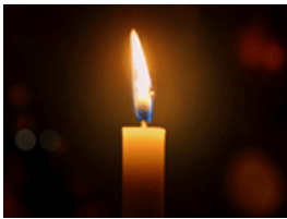
Erna Schö?lauf u. Erger Ein Licht auf die Reise ruhe in Frieden!